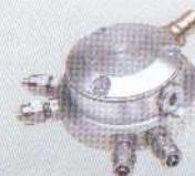
RIDUTTORE-VAPORIZZATORE GPL IG1 IG1 REGULATOR-VAPORIZER